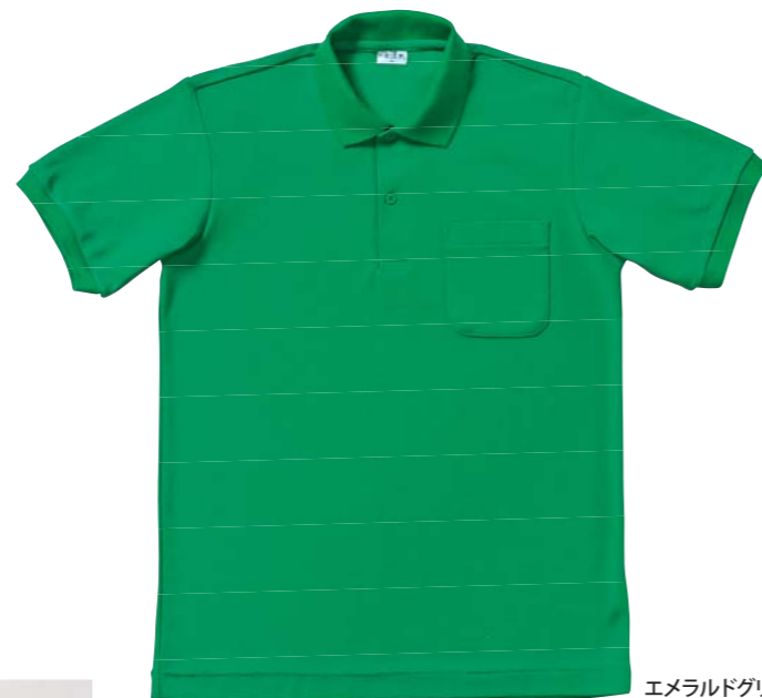
エメラルドグリーン